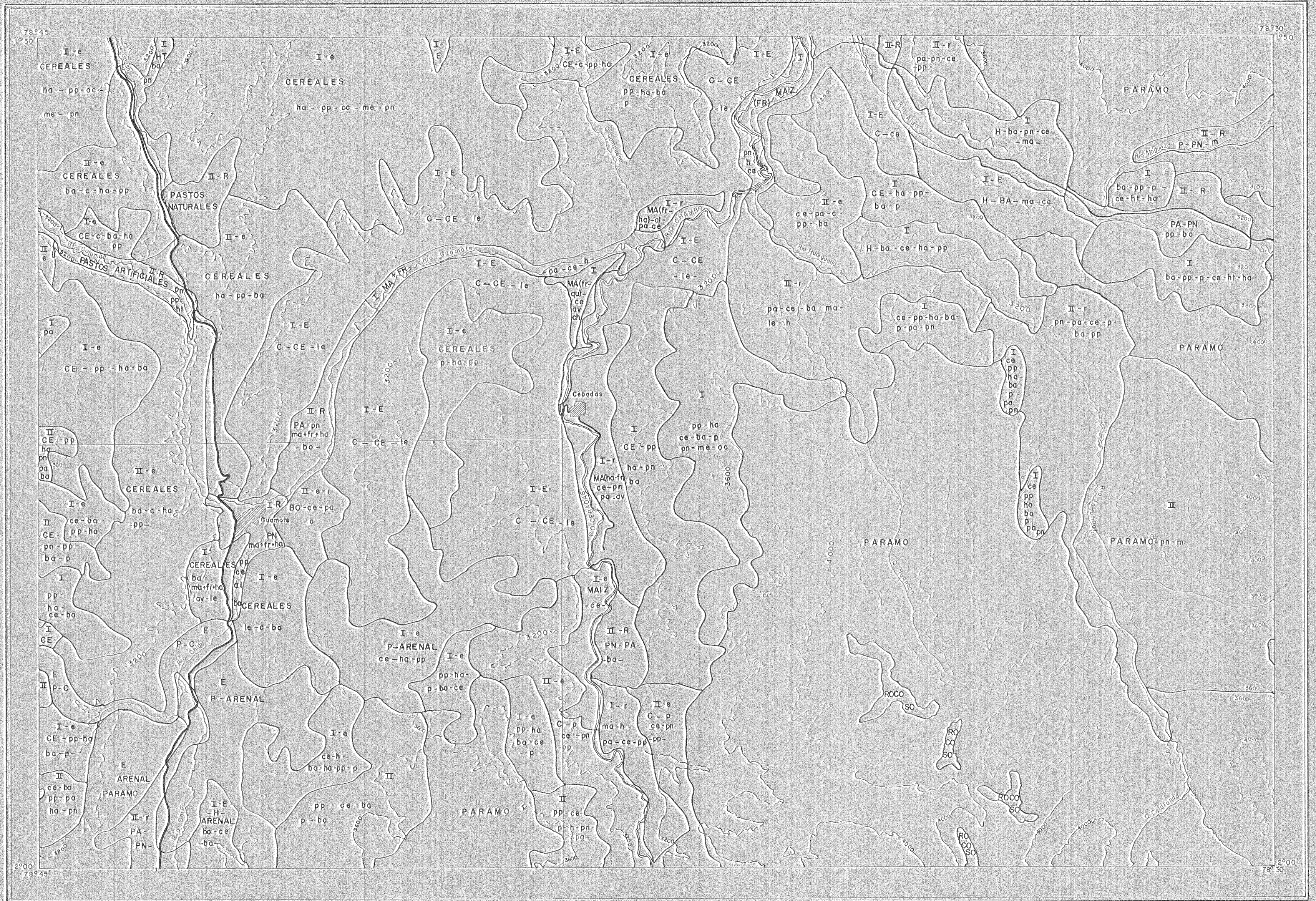
CARTA BASE TOPOGRAFICA DEL I.G.M.

ELABORADO POR: P. Gondard FOTINTERPRETACION: F. Lopez RESTITUCION: J. Vargas TRABAJOS DE CAMPO: G. Sotillo, R. Mesias DIBUJO Y PROYECCION: Sección Cartografía Fecha: 1976