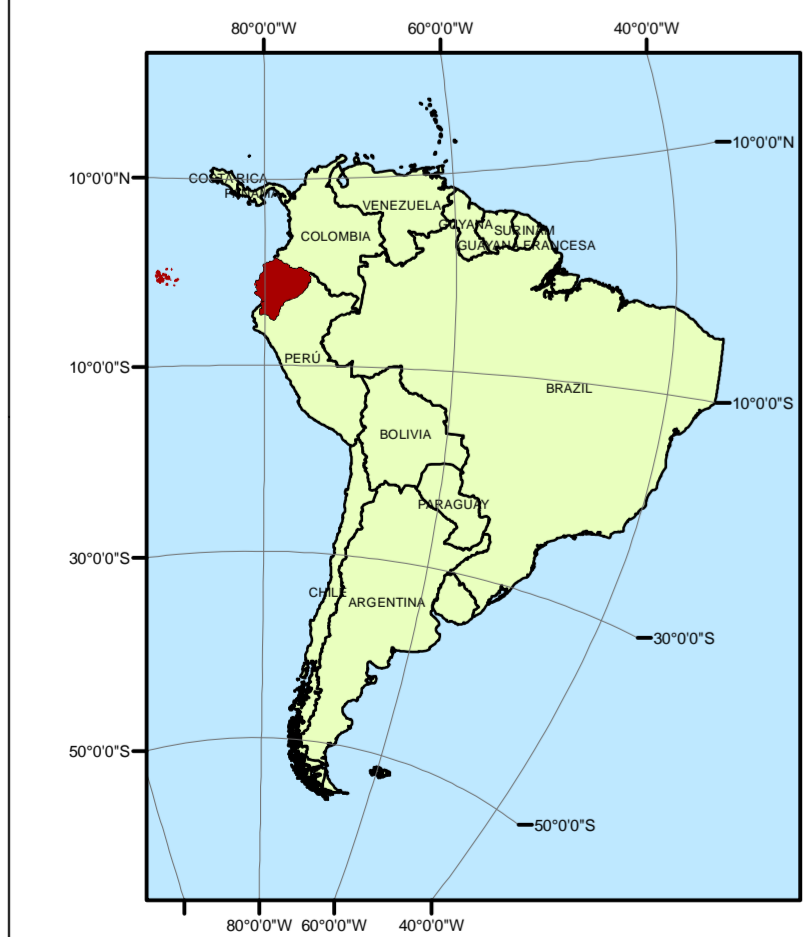
Ubicación del Ecuador Continental respecto a América del Sur