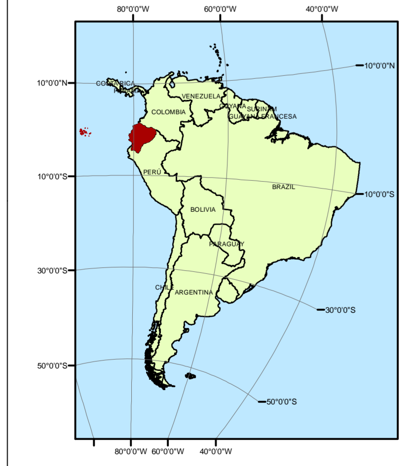
Ubicación del Ecuador Continental respecto a América del Sur

SÍMBOLOS CONVENCIONALES Drenajes Principales Ciudades Principales Cuerpo de agua Límite Provincial