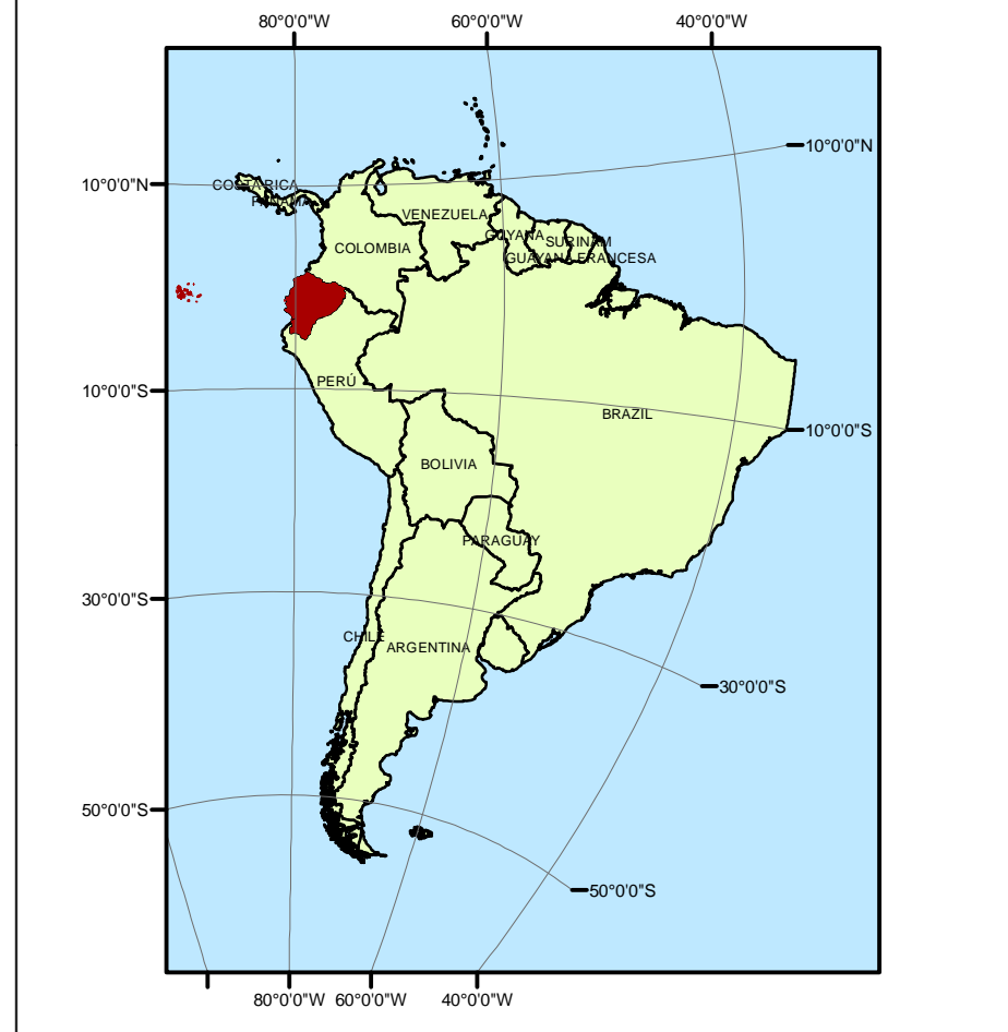
Ubicación del Ecuador Continental respecto a América del Sur