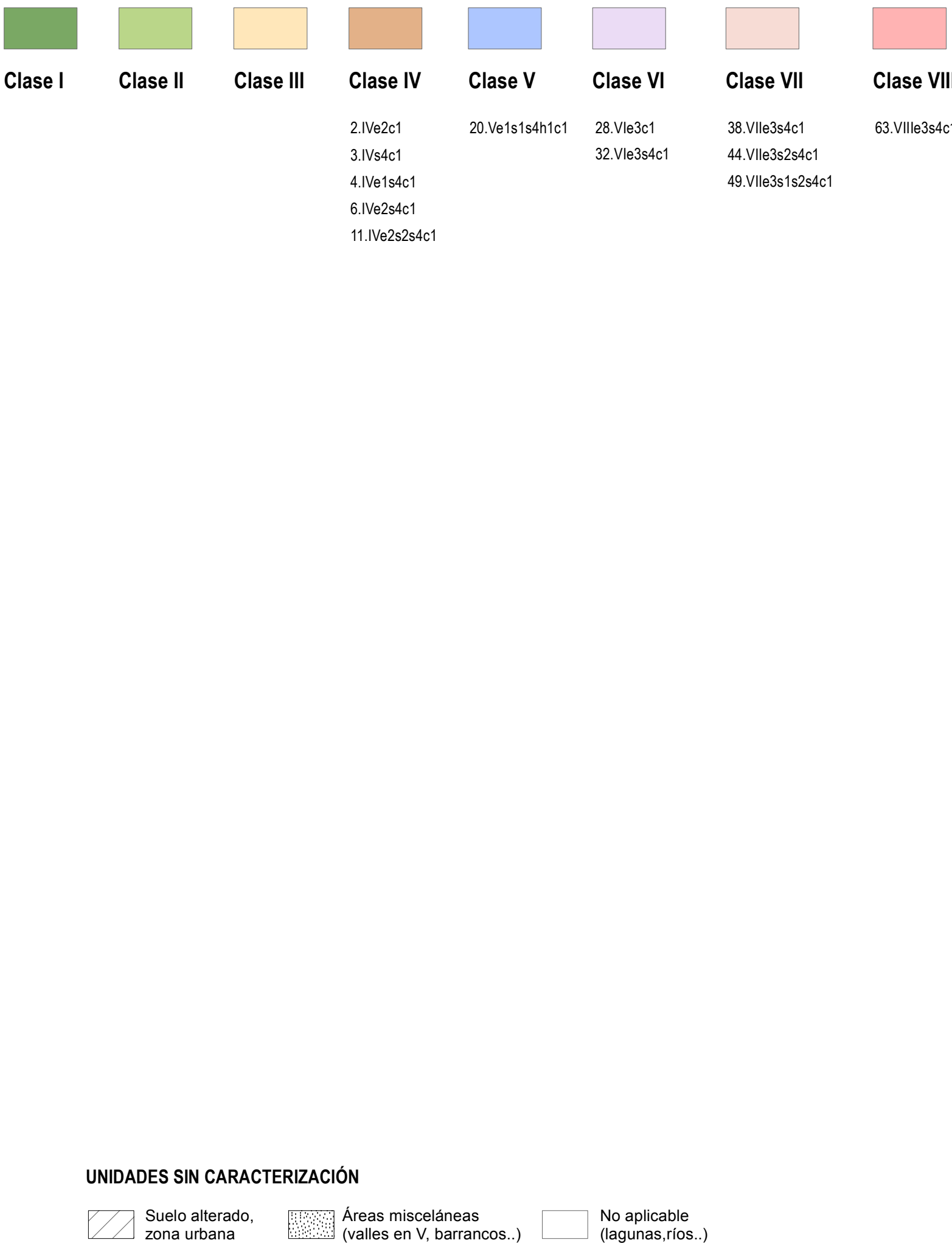
CLASES DE CAPACIDAD DE USC