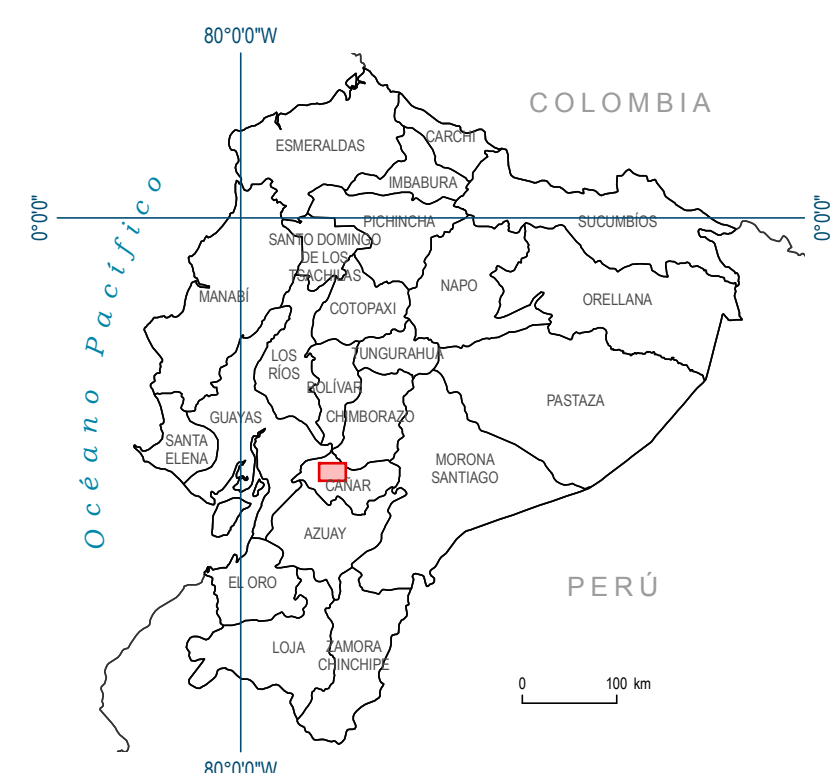
Base topográfica IGM CELIR, Límites Cantonales, escala 1:50.000, 2010-2012. (Carácter informativo y referencial)