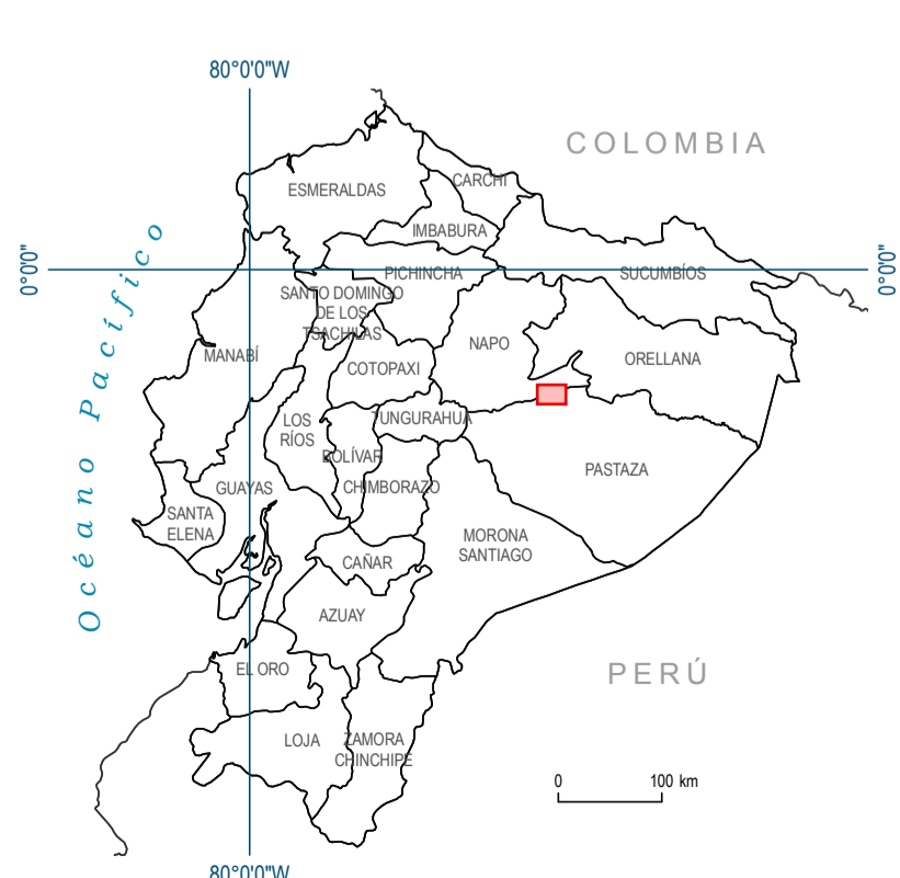
Base topográfica IGM CELIR, Límites Cantonales, escala 1:50.000, 2010-2012. (Carácter informativo y referencial)