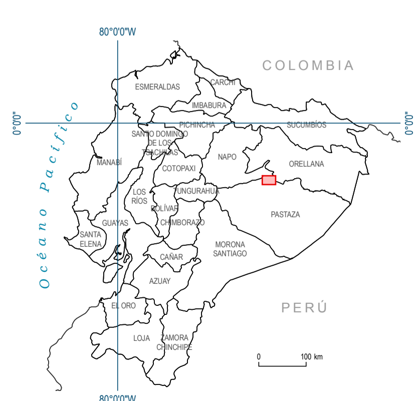
Base topográfica IGM CELIR, Límites Cantonales, escala 1:50.000, 2010-2012. (Carácter informativo y referencial)