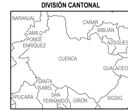
CELIR, Límites Cantonales, escala 1:50.000, 2010-2012. (Carácter informativo y referencial)