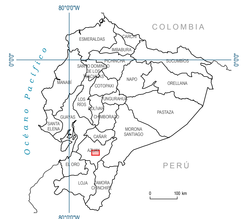
Base topográfica IGM CELIR, Límites Cantonales, escala 1:50.000, 2010-2012. (Carácter informativo y referencial)