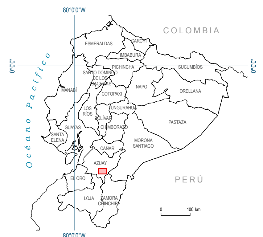
Base topográfica IGM CELIR, Límites Cantonales, escala 1:50.000, 2010-2012. (Carácter informativo y referencial)