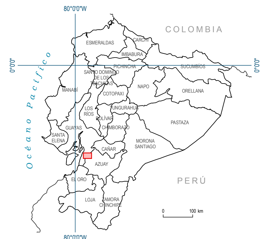
Base topográfica IGM CELIR, Límites Cantonales, escala 1:50.000, 2010-2012. (Carácter informativo y referencial)