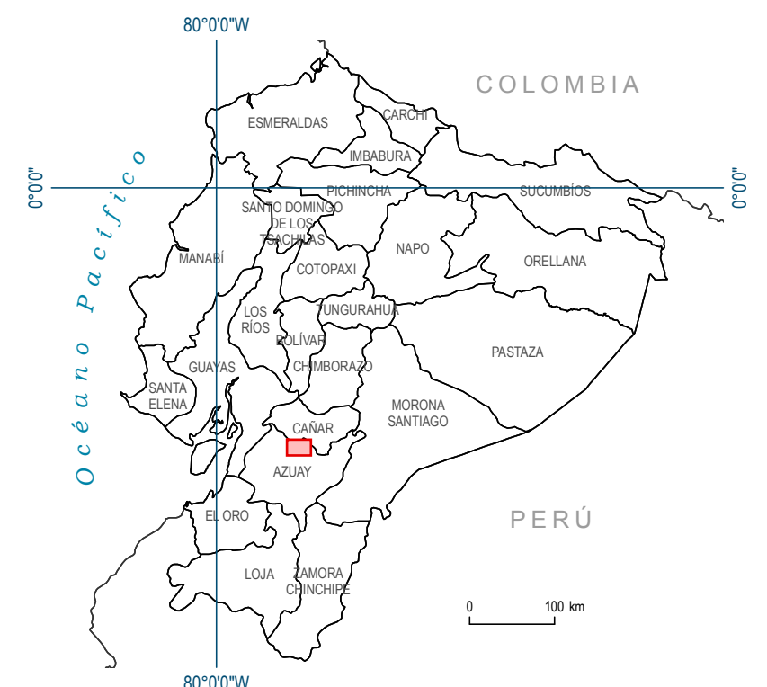
Base topográfica IGM CELIR, Límites Cantonales, escala 1:50.000, 2010-2012. (Carácter informativo y referencial)