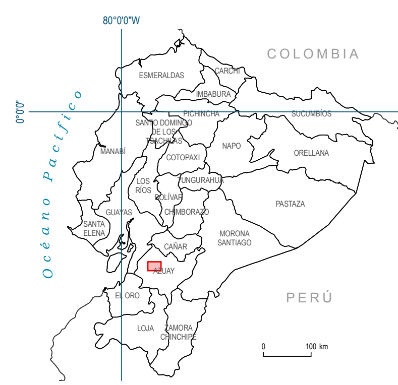
Base topográfica IGM CELIR, Límites Cantonales, escala 1:50.000, 2010-2012. (Carácter informativo y referencial)