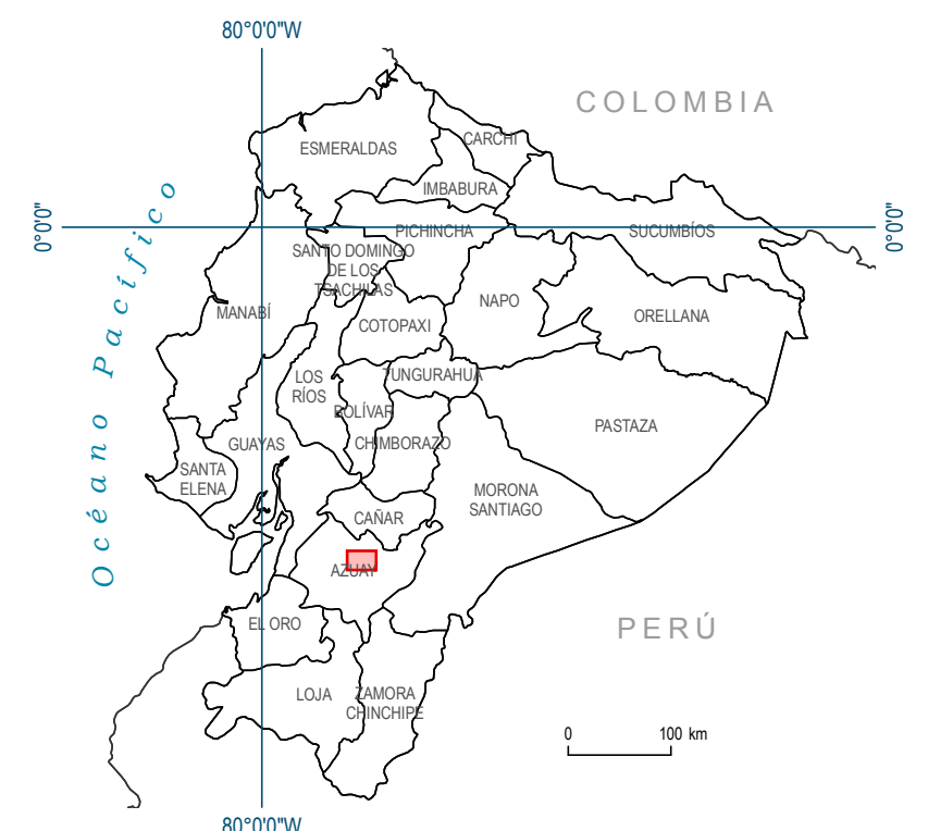
Base topográfica IGM CELIR, Límites Cantonales, escala 1:50.000, 2010-2012. (Carácter informativo y referencial)